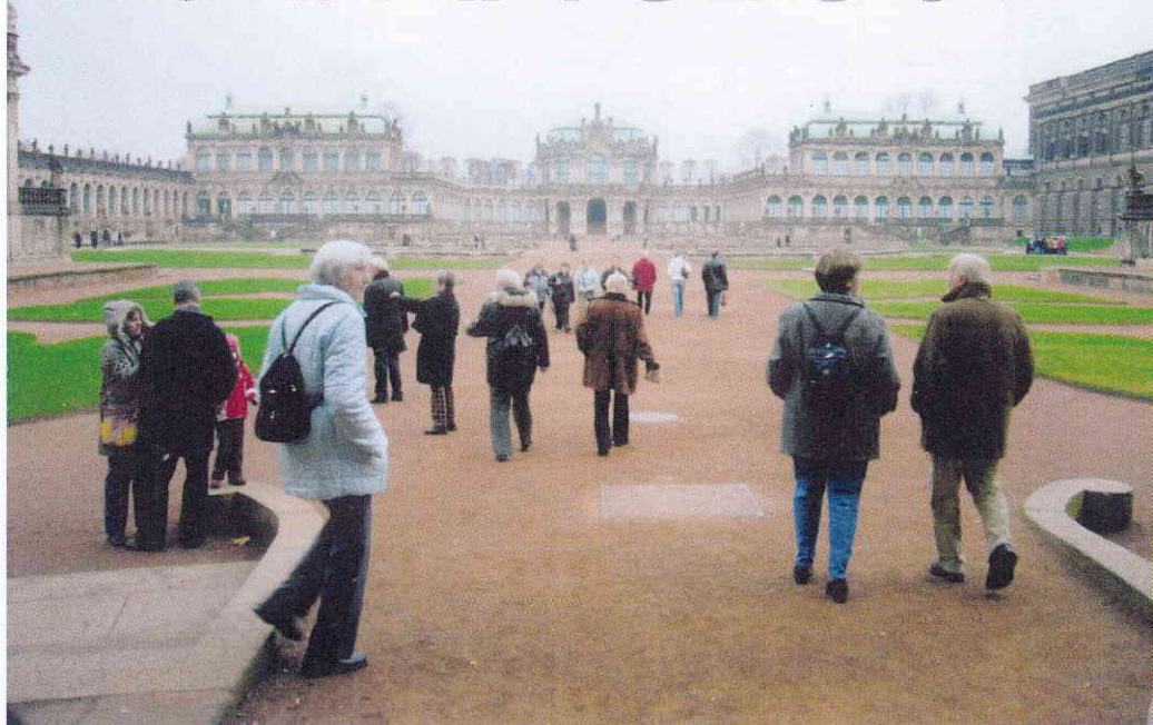
Der Zwinger, das Wahrzeichen von Dresden

Die Kreuzkapelle in der Kreuzkirche, wo ein 1234 gestifteter Splitter vom Kreuz Christi aufbewahrt wird.