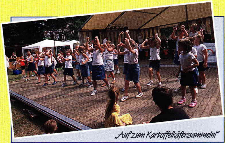
„Auf zum Kartoffelkäfersammeln!“