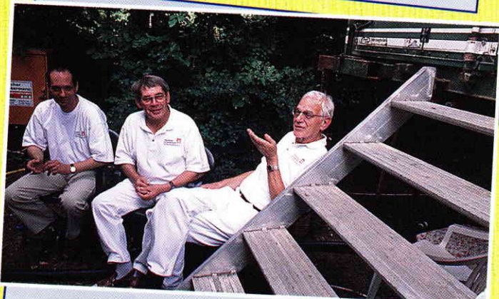
„Der neue Vorstand ist sich für keine Arbeit zu schade!“