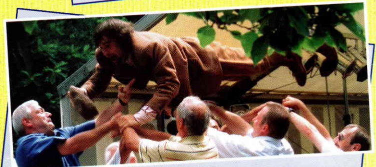
„Alles Gute kommt von oben!“