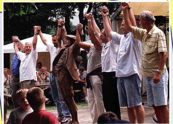
„Die Wahl der neuen Kassensprüfer: einstimmig!“