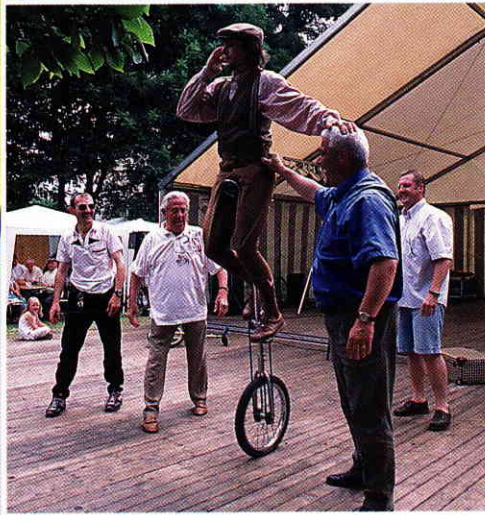
„Mein Gott - wer hat Dir denn die Haare geschnitten?“