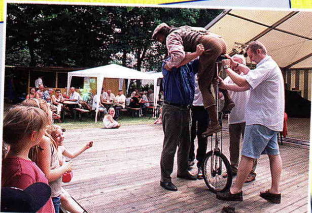
„Hat zufällig jemand eine neue Hose dabei?“